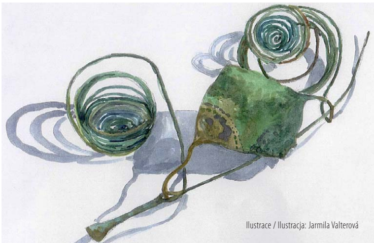
Ilustrace / Ilustracja: Jarmila Valterová